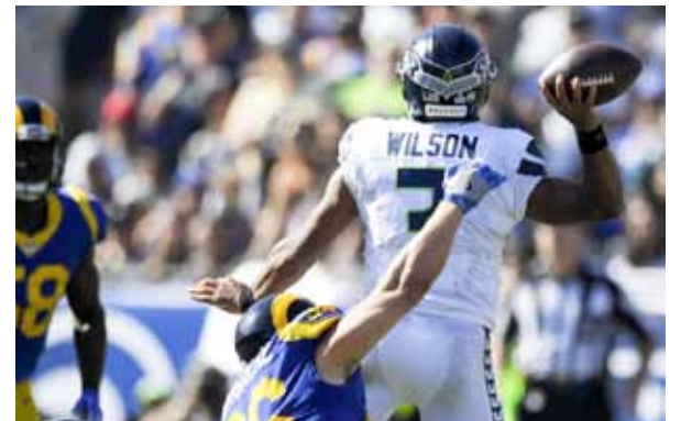
DEPORTES: Seattle comienza su semana de descanso > 10