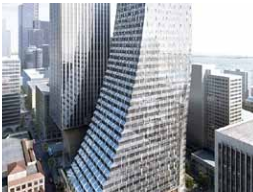
ESTADO: Amazon expandirá en el centro de Seattle > 3

Famosa por "Despacito", La Perla busca revivir tras huracán > 2