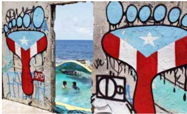
Esta foto del 25 de agosto de 2017 muestra una pareja nadando, enmarcada por un muro de hormigón cubierto con graffiti, en el barrio de La Perla, en San Juan, Puerto Rico. EN LA PORTADA: Esta foto del 25 de agosto de 2017 muestra una pancarta con Daddy Yankee y Luis Fonsi con un mensaje que dice: “Bienvenido a La Perla, donde se filmó Despacito”, en La Perla, en San Juan, Puerto Rico.

De hecho el turismo en todo Puerto Rico se ha detenido abruptamente y los únicos visitantes en La Perla desde la tormenta del 20 de septiembre han sido gente como