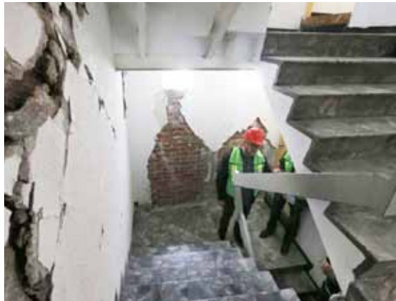
En esta foto de archivo del viernes, 22 de septiembre de 2017, el arquitecto Víctor Márquez se encuentra en una escalera durante la evaluación de un edificio dañado por el terremoto en la Ciudad de México.

Los tambaleantes edificios, muchos de los cuales presentan columnas destruidas o grietas severas, han incrementado los ya de por sí graves problemas de tránsito en