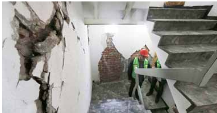
LATINOAMÉRICA: Ciudad de México comienza a demoler edificios dañados > 8