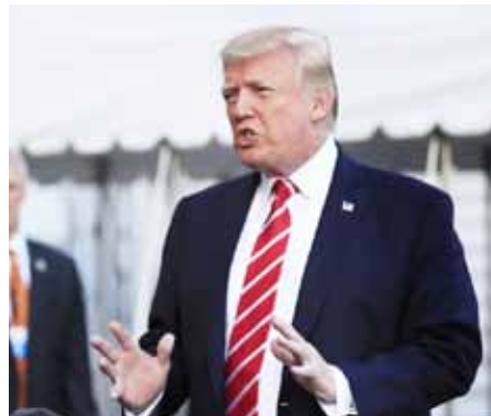
En esta fotografía del 7 de octubre de 2017, el presidente Donald Trump conversa con la prensa antes de partir de la Casa Blanca, en Washington, hacia Greensboro, Carolina del Norte.

También tuiteó que si el Congreso estaba indispuesto a efectuar una enmienda, él