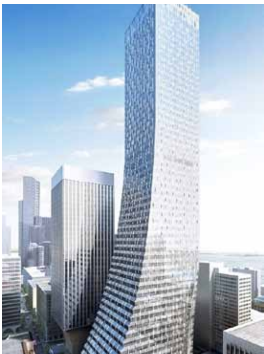
Representación del artista del nuevo rascacielos de 58 pisos llamado Rainier Square que se construirá en el centro de Seattle, Washington.

La noticia de que Amazon estaba buscando oficinas fuera de Seattle generó temores entre negocios y funcionarios locales de que la compañía pudiera reducir su compromiso con la región, y tiene a líderes estatales y municipales en otras partes del país tratando de atraer los beneficios y empleos de una sede.